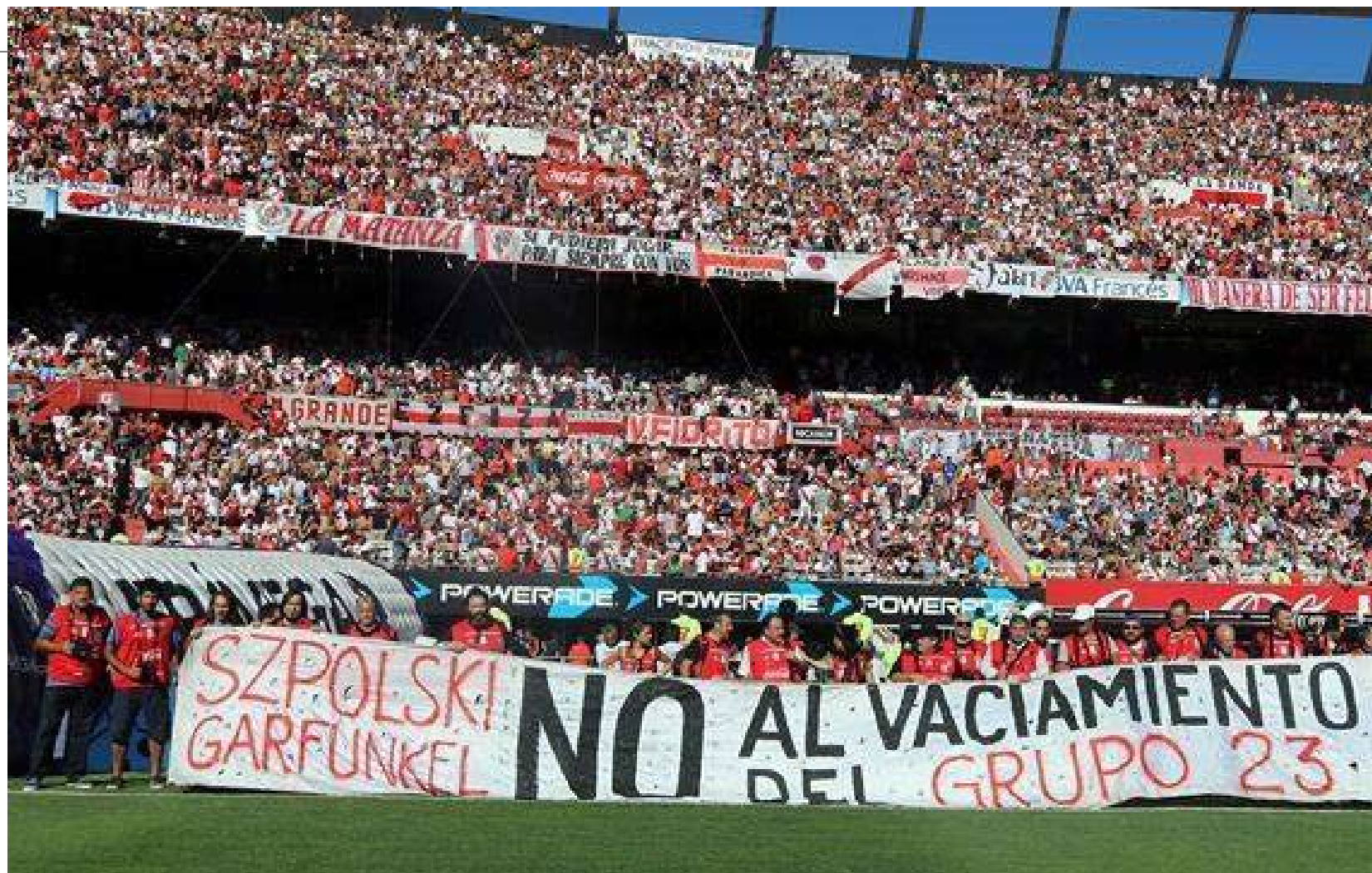
Los miles de hinchas de River que estuvieron en el Monumental pudieron enterarse de la denuncia contra el vaciamiento gracias a la acción de los reporteros gráficos

No fue casualidad que la bandera apareciera en un River-Boca. No sólo estuvo allí porque es el evento deportivo más esperado del país. Ni tampoco porque el primer domingo de marzo, con un sol que brillaba más que un mueble lustrado con Blem, invitaba a