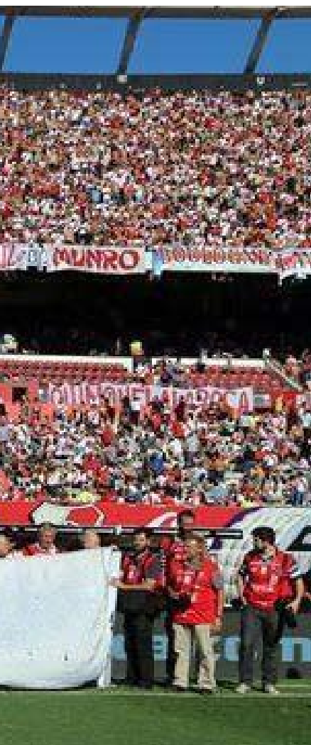
Cleados en ARGRA.