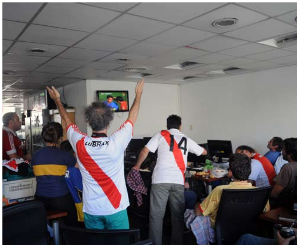
Una de las tantas escenas de un Superclásico que no saldrá en las páginas de Tiempo Argentino .

siguió los vaivenes del partido por tevé. Se quedaron con las ganas de elegir a Nicolás Domingo como la figura, de criticar la actuación de los laterales de Boca o de intentar explicar lo inexplicable: cómo hicieron Iván Alonso y Rodrigo Mora para no meter el gol a diez minutos del final, cuando un centro del Pity Martínez los dejó solos frente al arco de Boca sin más oposición que Agustín Orion.