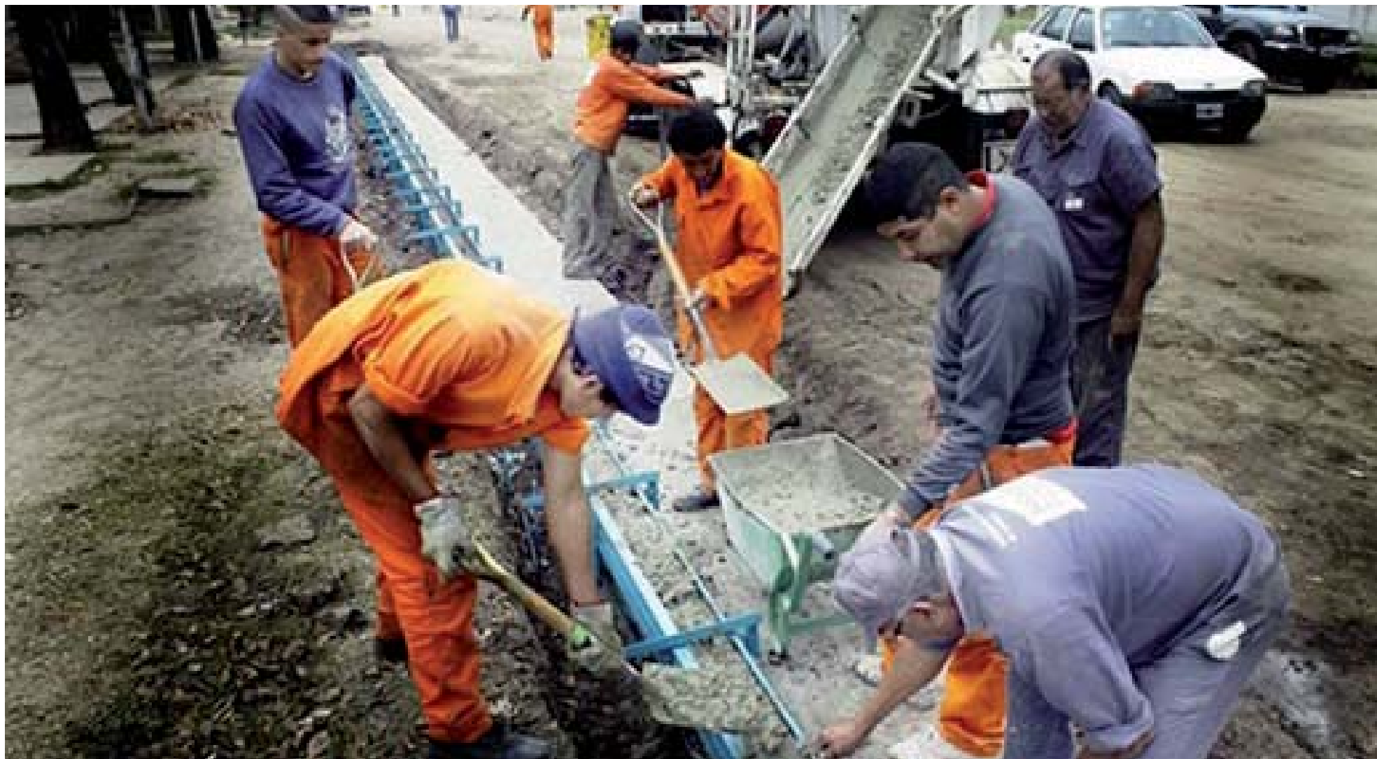
Al igual que en la actividad de prensa, en la construcción abundan las patronales que aplican el trabajo no registrado y retienen en forma indebida los descuentos previsionales de los trabajadores.

El gobierno PRO de Mauricio Macri estudia dar un nuevo zarpazo sobre los derechos de los trabajadores. Según aseguró ayer el matutino Página 12, el Poder Ejecutivo busca modificar la ley previsional, de forma tal de crear una "prestación universal" de supervivencia destinada a los trabajadores que no hayan podido completar sus aportes previsionales en tiempo y forma. Es decir, el macrismo pergeña un proyecto de ley que focaliza sobre el trabajador el costo de la evasión patronal de los aportes y contribuciones previsionales, fraude que se lleva a cabo bajo las mismas narices del Estado, que debería controlar que no suceda.