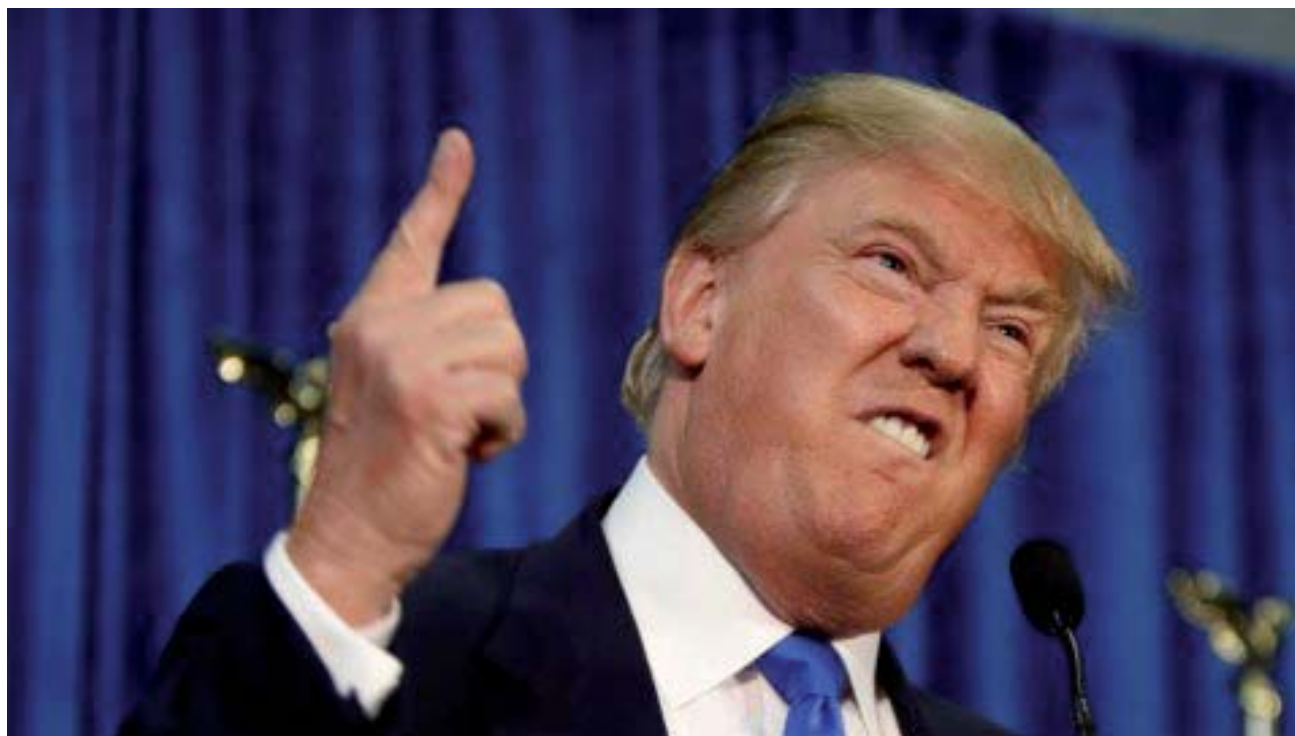
Trump hizo fortunas con el negocio inmobiliario y se asentó como dirigente con el soporte de la industria mediática.

Con el premio a Spotlight Hollywood (en su posición como industria, como si se tratara de alguna cámara de una rama de la producción) marcó posición. Especialmente en lo que hace a lo que consideran que debe ser el periodismo, cómo se debe conducir y hacia quién tiene que apuntar; en los términos del film: hacia algún poder y no hacia los corrillos de farándula, y menos a sus desgracias. En un sentido más general, Hollywood dice que el periodismo debe hacerse eco de lo que verdaderamente necesita una sociedad (en este caso la de Estados Unidos): que sus miembros estén informados acerca aquello que “el poder” (cualquier po-