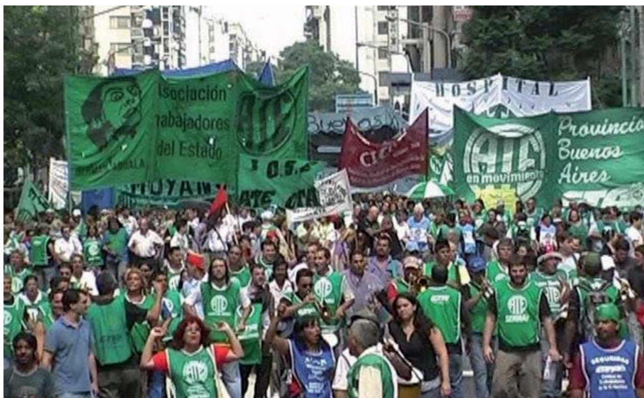
Marcha de trabajadores estatales en febrero pasado, en rechazo a los despidos en el sector.

Se admite en el texto que durante los 60 días iniciales de este 2016, los despidos llegarían a 107.000, lo que significa un crecimiento de medio punto porcentual a la tasa de desempleo, que el gobierno macrista oculta al cerrar la posibilidad de que el Indec siga