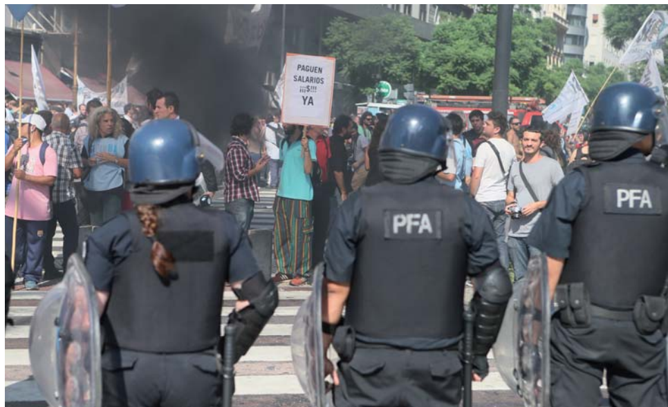
La policía amenazó con reprimir a los trabajadores de prensa en la marcha del 4 de marzo.

En la tarde del jueves 4 de marzo, una enorme movilización interrumpió por dos