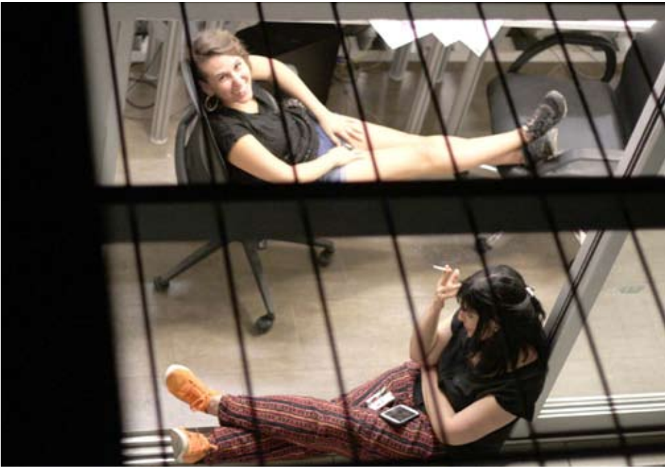
La permanencia en el edificio donde funcionaba el diario ya lleva un mes y una semana.

Cuatro marchas al Ministerio. Que no rindieron frutos aún.