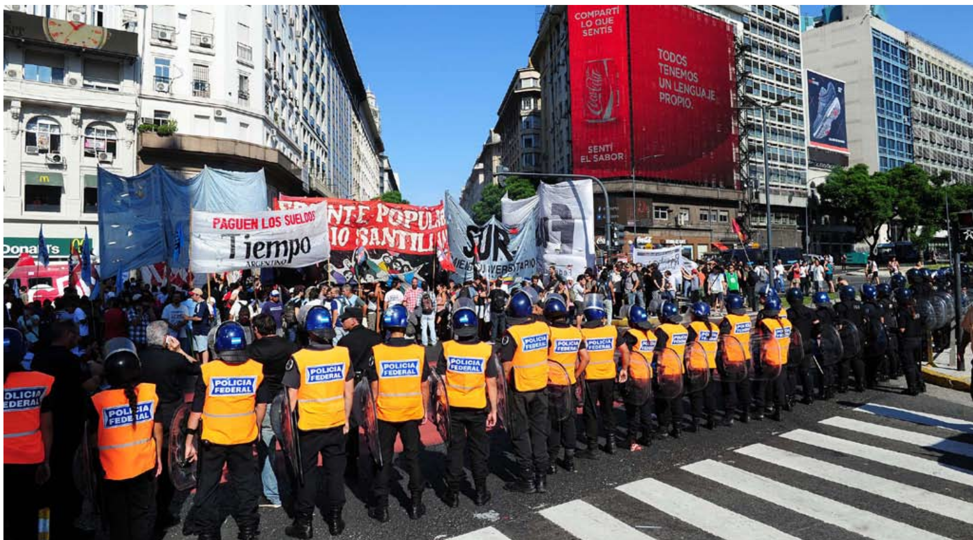
Una imagen de la marcha que realizaron los trabajadores de Tiempo Argentino y Radio América desde el obelisco hasta la Plaza de Mayo. Cortaron durante dos horas el centro de la ciudad.