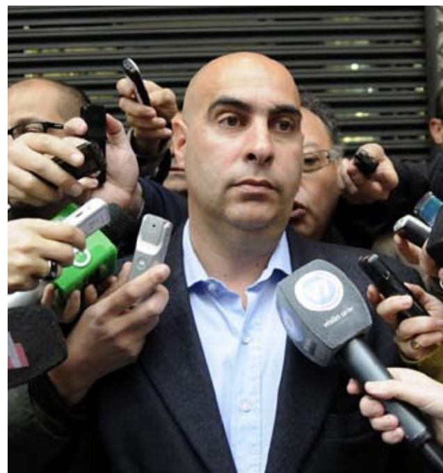
El funcionario PRO no se sentó a dialogar por Tiempo y América .

Después de una conversación telefónica, Sabor se comprometió a tener una reunión con los delegados el lunes pa-