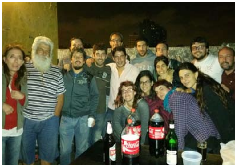
Los compañeros durante el asado que se realizó en la terraza del edificio.

La permanencia pacífica en nuestro lugar de trabajo tiene sus cosas. Entre anécdotas, muestras de solidaridad, charlas y pocas horas de sueño, aparecen situaciones que cumplen con un requisito básico: qué comer cuando el hambre aprieta. Ejemplos hay muchos y nos podemos detener en el ocurrido el jueves por la noche, cuando un grupo de militantes del Partido Obrero de Belgrano (así como otro día pasó con otras agrupaciones políticas o sociales) donó un asado para todos los trabajadores de Tiempo Argentino que se queda-