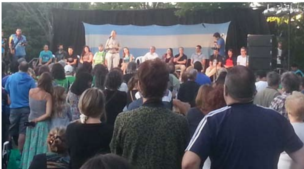
MULTITUD. El evento tuvo una asistencia masiva de vecinos que colaboraron solidariamente.

en Capital. En un contexto donde tenemos un gobierno que actúa no sólo como pa-