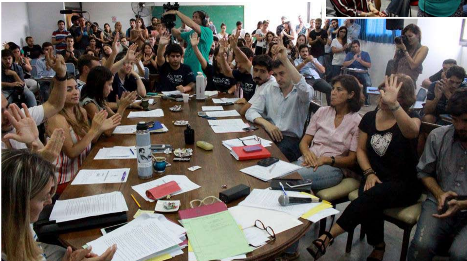
VOTACION UNÁNIME. Los consejeros de todos los claustros aprobaron el primer pronunciamiento de una universidad pública contra la ola de despidos en prensa.

El escrito –impulsado por el claustro docente y consensuado por todas las expresiones políticas estudiantiles–, manifiesta que la Facultad de Periodismo y Comunicación Social (FPyCS) denuncia “el incumplimiento del Gobierno Nacional de la promoción de la pluralidad de voces”. Y puntualiza que ese no cumplimiento se “evidencia no sólo en el desplazamiento de los trabajadores de prensa que han expresado una posición crítica al gobierno; sino también impulsando la censura de periodistas y contenidos; o simplemente callando ante la censura de las empresas periodísticas privadas; así como la persecución ideológica y manipulación mediática contra funcionarios y ex