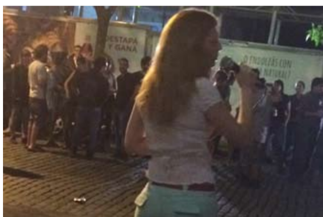
Embelesados por el clown ayudó a descontracturar una jornada difícil que luego levantó con Los tambores no callan y nuestra Laura La Duquesa.

sacó la modorra y superó las vacilaciones cuando un compañero preguntó... ¿podemos ganar plata para el fondo de lucha? ¿Hay algo mejor que hacer ahora? “Si vendemos dos patís y una cerveza ya estamos ganando”, retrucó otro. No se habló más. En 20 minutos, incluidos los trabajadores que legítimamente consideraban que no valía la pena hacerlo, organizaron la barra, las luces, los parlantes, la parrilla y empezaron a tuitear y enviar whatsapp