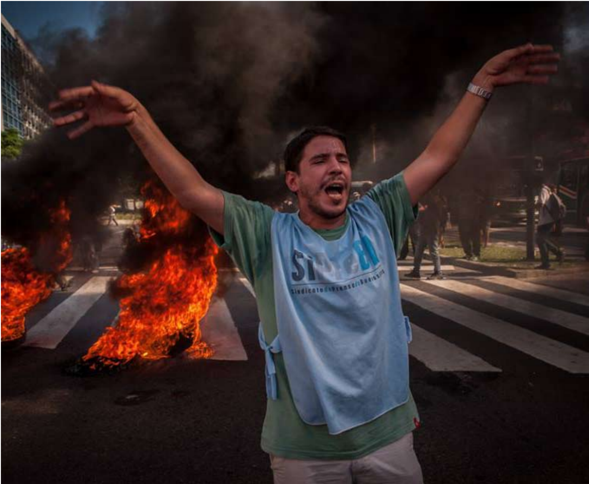
DESDE EL OBELISCO A PLAZA DE MAYO. El gremio de prensa marcó a fuego el arranque de marzo con una movilización histórica.