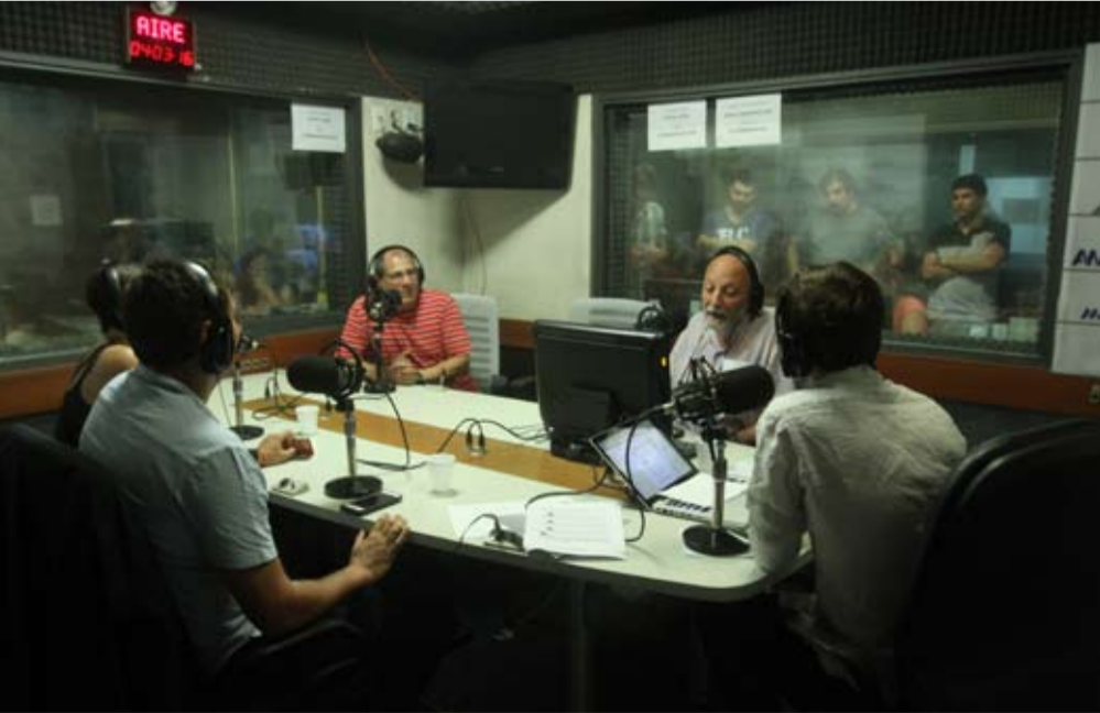
EN EL AIRE. Luego de ocho semanas de paro, el estudio central de la radio volvió a transmitir gracias a la fuerza de sus trabajadores y la solidaridad de los invitados. Un lujo para la lucha.