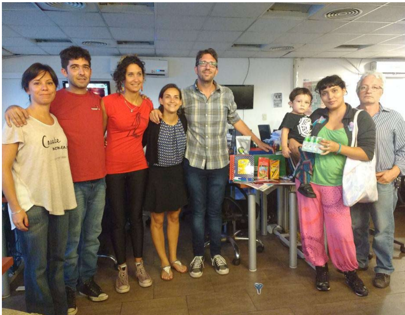
Trabajadores de Telam recolectaron útiles y plata. Las donaciones llegaron de todo el país y hasta desde México.

La colecta colectiva que impulsó una compañera de Revista 23 permitió que los pequeños de 30 compañeros del diario pudieran contar con un kit escolar para el comienzo del ciclo lectivo. Pudieron cargarlos en las mochilas que donó el Sindicato de Aceiteros cuando visitaron la redacción del matutino.