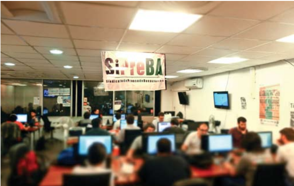
Los trabajadores de Tiempo volverán a editar el diario cada semana para hacer frente a la estrategia de vaciamiento de la patronal.

La edición de Tiempo fijó agenda propia en el debate por el proyecto del gobierno de pago a los fondos buitre con una cobertura que incluyó la revelación del entramado del lobby internacional para volver a endeudar a la Argentina. Los nombres de Paul Singer -titular del principal fondo buitre que litiga contra el país- ; el primer ministro de Israel, Benyamin Netanyahu; y el precandidato a presidente de EE UU, Marco Rubio, son las piezas del rompecabezas descripto en la nota que sostiene el título principal de portada. El mapa se completa con un pormenorizado análisis del rol y peso de los bancos JP Morgan y Deutsche Bank en la negociación que el ministro Alfonso Prat-Gay mantuvo con los holdouts.