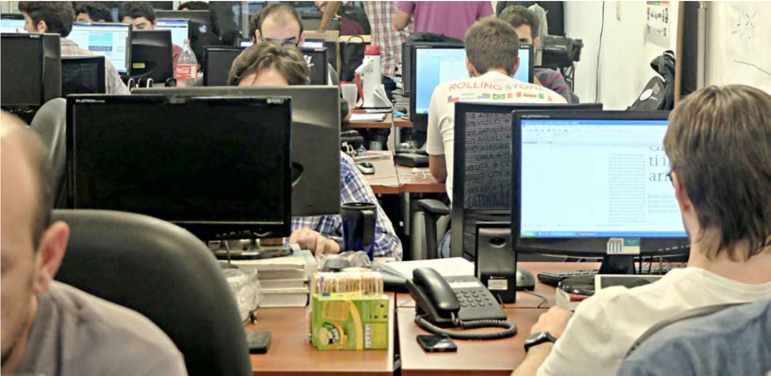
La decisión de editar el diario cada semana permitirá acercar a los lectores numerosas producciones de fondo y con una mirada propia.

El capítulo doméstico del acuerdo se jugó en el Congreso. Y Tiempo contó que el oficialismo buscó garantizarse una sesión sin público y un Parlamento vallado para el desarrollo de una sesión con fuertes contrapuntos asegurados. Además, la edición del diario en formato digital incluyó un pormenorizado análisis de las declaraciones del presidente estadounidense, Barack Obama, sobre el gobierno de Cristina Fernández de Kirchner como una clave sobre su próxima visita al país el próximo 23 de marzo. En la numerosa cantidad de no-