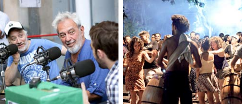
Radios Abiertas, festivales y obras de teatro solidarias en la puerta de Amenábar 23.