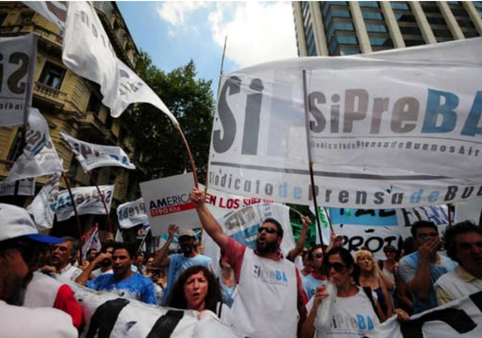
Movilizaciones callejeras junto con el Sindicato de Prensa de Buenos Aires.