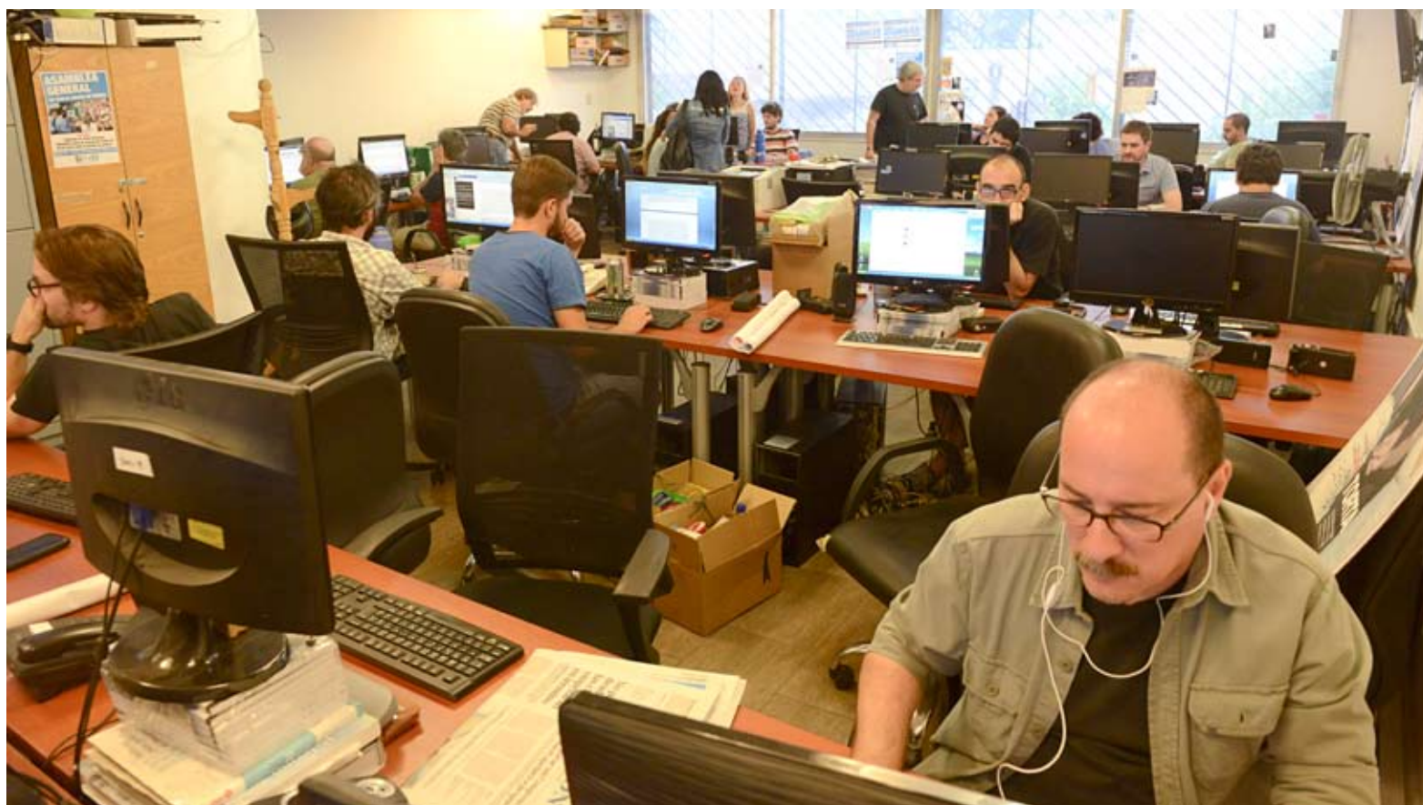
La asamblea de Tiempo resolvió la salida de una nueva edición para desafiar el lock out y reforzar el sustento económico a partir del ejercicio de la profesión.

Pero el 26 de febrero, la asamblea de Tiempo Argentino , empujada por la necesidad de responder al lock out patronal y de darle vida a este diario que llegó a las calles durante 6 años, decidió elaborar una edición de Tiempo Argentino que, el 29 de febrero, fue subida a los soportes web oficiales, tanto en formato PDF como en plataforma Web y hasta en Facebook.