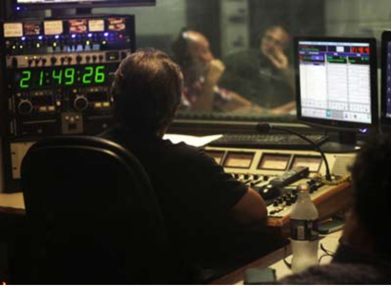
En el estudio de Am 1190 dijo que buscará que Triaca reciba a los trabajadores.