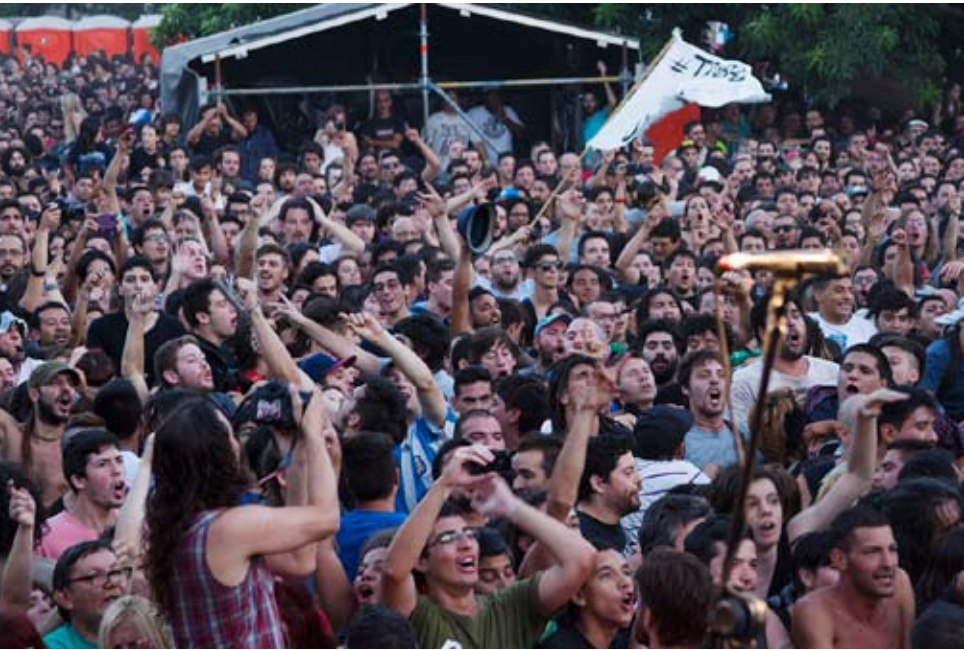
El 31 de enero el festival en Parque Centenario superó todas las expectativas