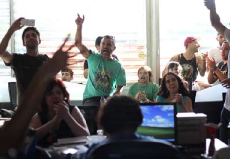
La salida del diario no va en desmedro del reclamo para que paguen los responsables.

materia de pauta. Por el contrario, la salida de un nuevo número de Tiempo Argentino apunta a reforzar esa pelea para que sean los vaciadores quienes se vean obligados a capitalizar el diario en la medida en que los trabajadores siguen dando muestras de su amor por la profesión y su abnegada convicción de que tiene derecho a cobrar por el trabajo realizado. El lunes 14 sobre las 16:00, la redacción del diario, en Amenábar 23, volverá a latir como en los viejos tiempos,