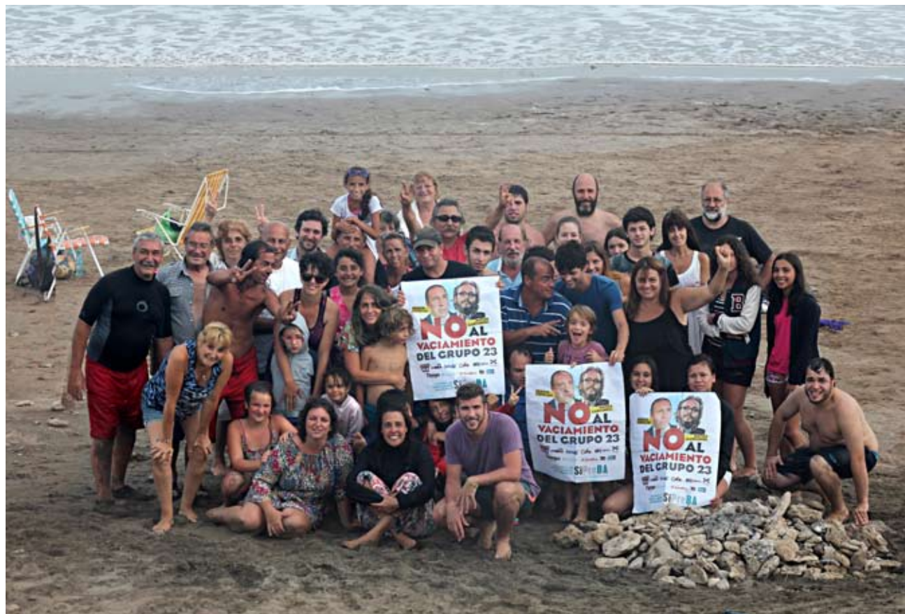
CREATIVIDAD EN LA ADVERSIDAD. Un miembro de la brigada de artistas de nuestra asamblea construyó esta postal.