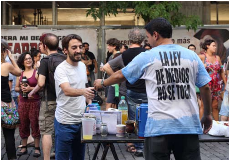
PARO. Los trabajadores de la radio llevan 35 días en cese de actividades y en asamblea permanente.

Las Comisiones Internas de América firmaron un acta en