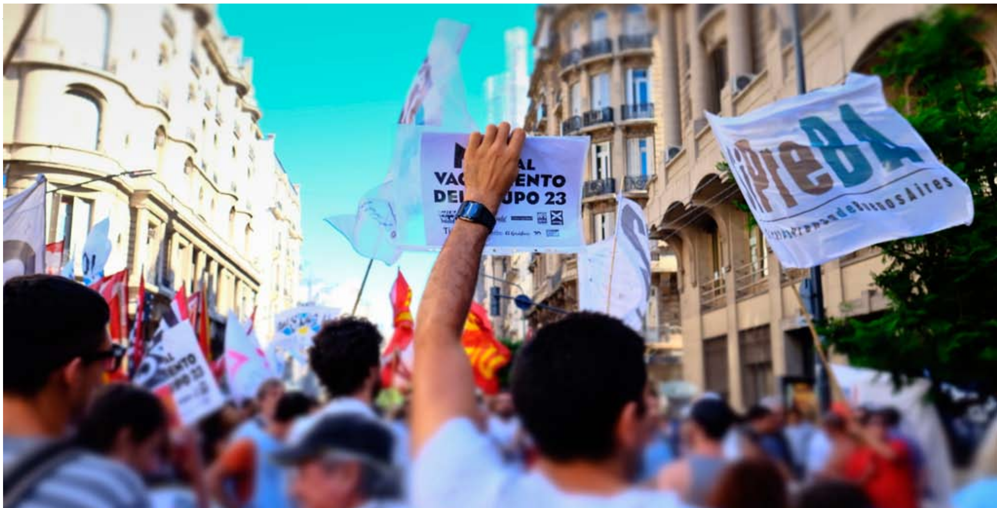
AGUANTE. Media hora antes del arranque de la audiencia, cientos de compañeros del gremio y de organizaciones políticas y sociales cortaron Avenida Callao.