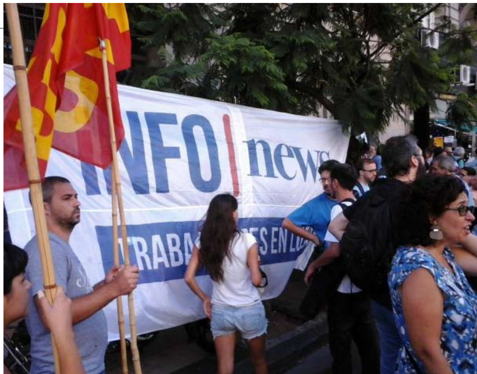
La movilización habilitó una audiencia para que el Ministerio se anocie de la grave situación.

FESTIVAL. El 31/1 más de 25.000 personas rodearon de solidaridad a los trabajadores en Parque Centenario. La lucha continúa y ahora llegó, desde la semana pasada, a las puertas del Ministerio de Trabajo, luego de tres movilizaciones y sendas denuncias.