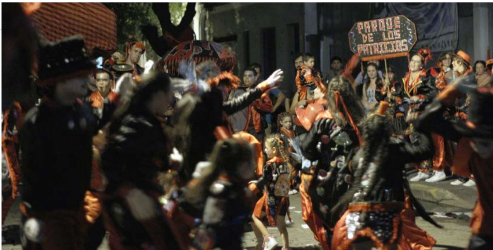
LOS MONARCAS DE LA FIACA, ANTES DE LA MEDIANOCHE. Cuando el festival estaba por terminar llegó el grupo que recorrió todos los corsos de aquél lunes carnavalesco.