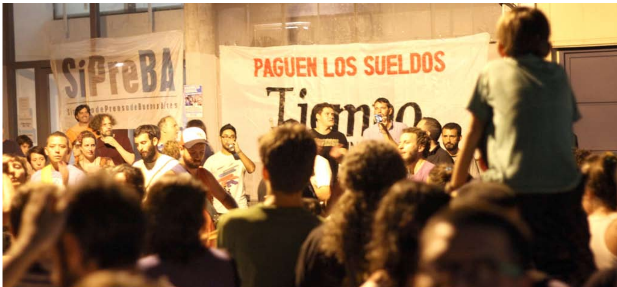
UNA NOCHE DE LUNES INOLVIDABLE. Entre las 21 de ayer y las 2 de hoy la puerta del diario vibró con tango, candombe, murga, folklore y rock. Cada compañero vino con su familia.

El clima denso, pastoso, contrasta con el espíritu inquebrantable de los trabajadores que canalizan la angustia y la incertidumbre con alegría y organización. Un cielo re-negrido amenaza con arruinar la fiesta. Los músicos van llegando mientras los adosquines de la calle Amenábar se convierten en sostén de la parrilla que asará los choris y de los tachos cargados de hielo que enfriarán la bebida. Periodistas, diagramadores, fotógrafos y otros empleados del diario realizan distintas tareas en la previa del evento. Todos comprometidos, todos decididos a seguir con la lucha.