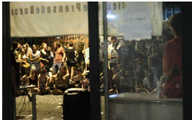
DESDE ADENTRO. Una mirada que captó, desde la redacción, el clima de la noche.