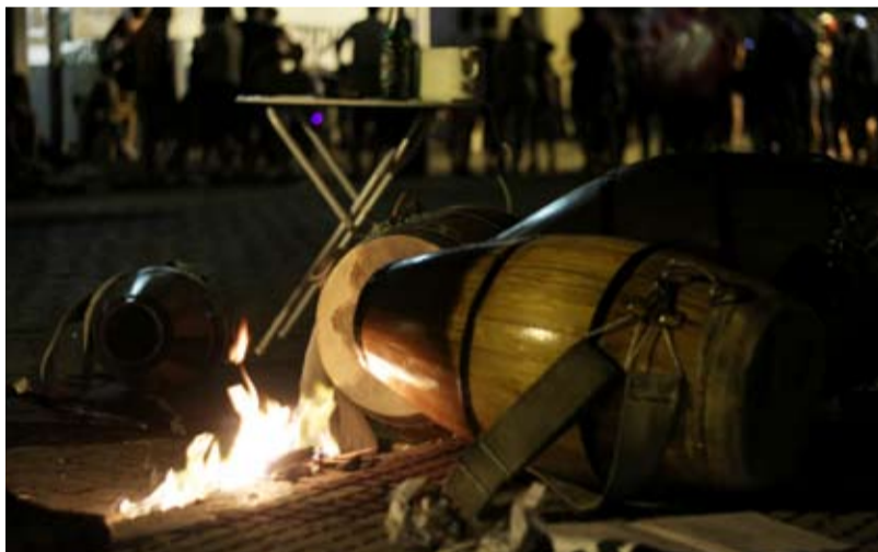
CALOR DE LUCHA. Los tambores del candombe ardieron en la calle para vibrar.