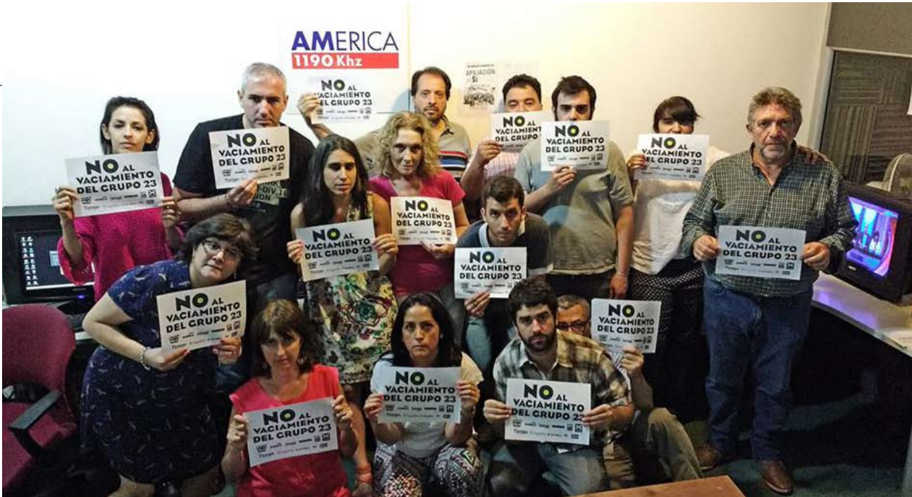
AGUANTE. La asamblea de trabajadores la emisora está por cumplir un mes de paro.

El jueves pasado M Deluxe se comprometió en el Ministerio de Trabajo a pagar una primera cuota de 8000 pesos