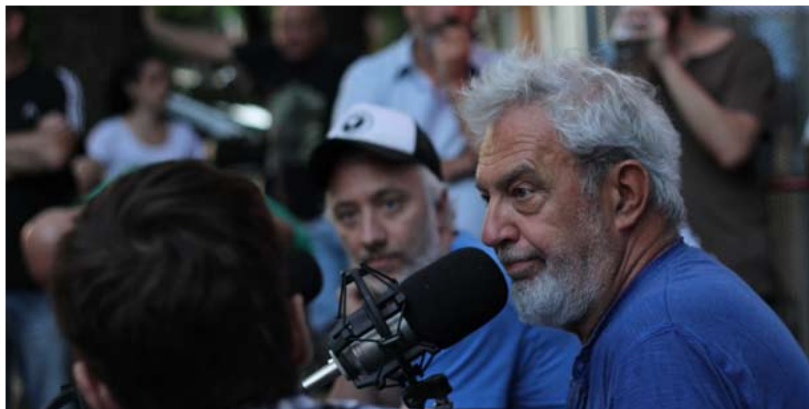
DIAS DE RADIO. Los dos conductores dialogaron con los protagonistas del conflicto. El público cortó la calle.

ferentes de la radiofonía argentina, la mesa se amplió durante casi dos horas, mientras llegaban emocionados los mensajes de los oyentes saludando este regreso eventual.