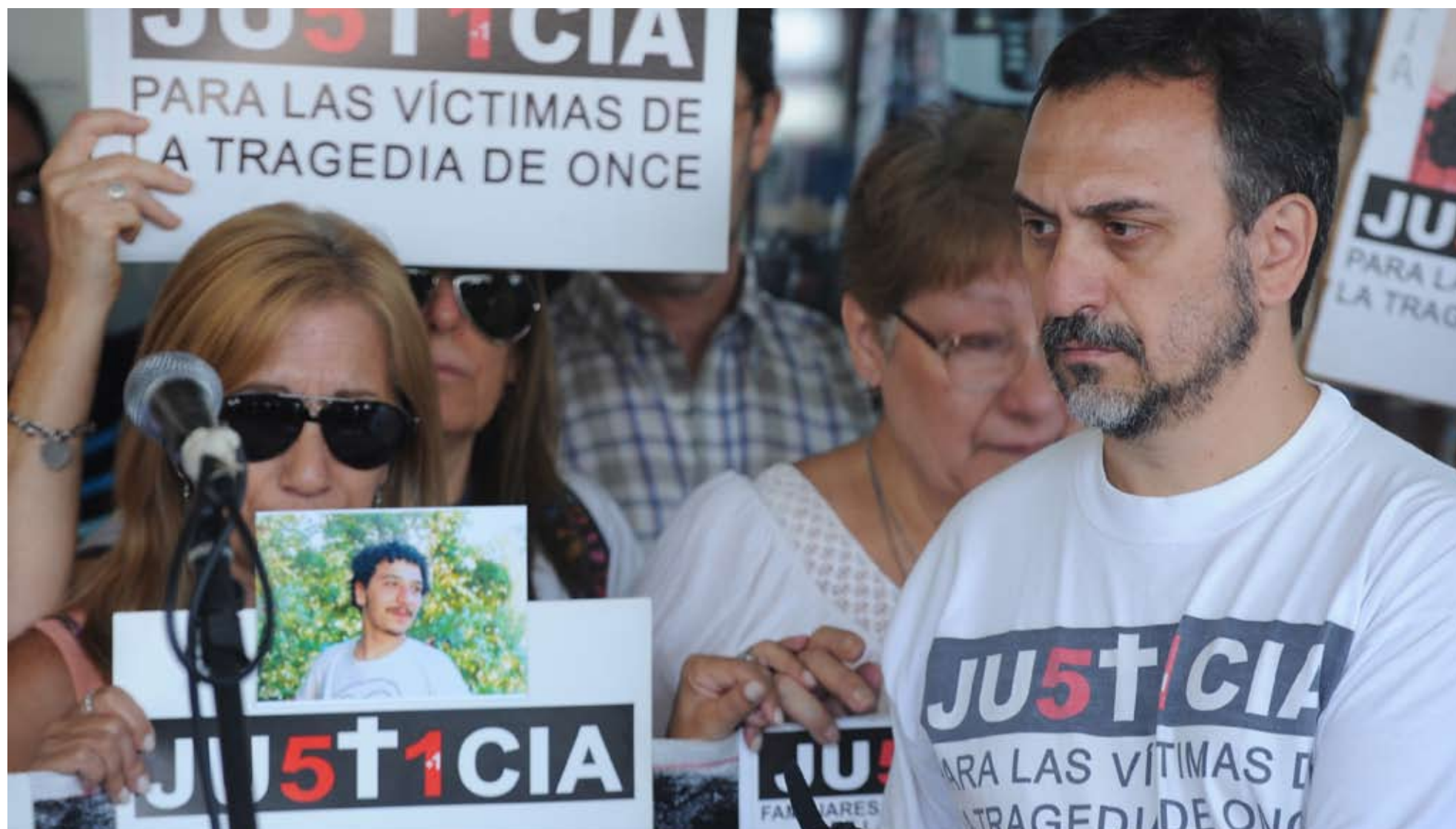
UNIDAD EN LA LUCHA. Tras años de peregrinar contra la impunidad y la corrupción, esta vez hubo un acto unificado para aguardar que la Cámara confirme el fallo condenatorio de primera instancia.